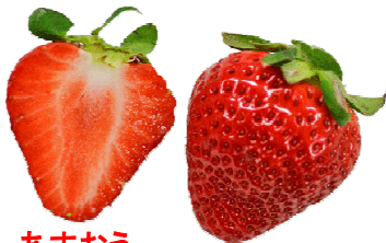
あまおう 福岡県オリジナル。2005年登録。名称は赤い・丸い・大きい・うまいの頭文字