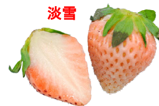
淡雪 来歴不明、鹿児島県で育成、2013年登録