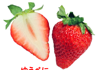
ゆうべに 熊本県オリジナル。2017年登録。かためで濃厚な味わい