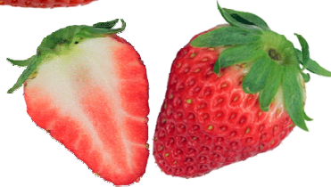
紅ほっぺ 静岡県オリジナル。2002年登録。香り高く、甘酸っぱい