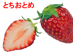
とちおとめ 栃木県オリジナル。1996年登録。長く親しまれ、生産高全国一