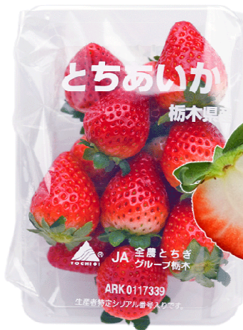
とちあいか 栃木県オリジナル。2020年夏に名称が決定した注目の新品種。「とちおとめ」より大きめで、酸味が少なく甘みが際立つ

「紅ほっぺ」、「さがほのか」の順。大田市場への産地別入荷数量トップ10は、栃木が断トツ1位、2位福岡、3位静岡、4位佐賀、次いで群馬、熊本、宮城、奈良、茨城、長崎の順になっています。