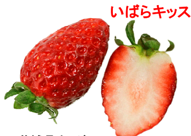
いばらキッス 茨城県オリジナル。2012年登録。かためで多汁で濃厚な食味