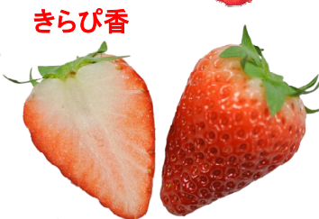
きらび香 静岡県オリジナル。2017年登録。かためで香り高く、食味がよい