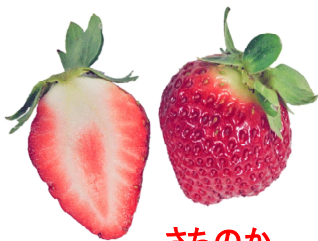
さちのか 農水省の久留米支場育成。2000年登録。ピタミンC含量が多い