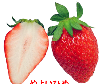
やよいひめ 群馬県オリジナル。2005年登録。「弥生(3月)」でも高品質を維持