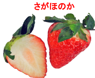
さがほのか 佐賀県オリジナル。2001年登録。甘味強く、多汁、日持ち性良好