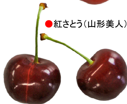
●紅さとう(山形美人)