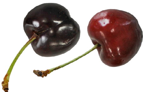
●アメリカンチェリー